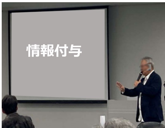
ワークショップのイメージ

災害・事故などと同様、もしもの時を想定し、いかに傷を浅くし、いかに早く許容できる水準で事業を再開できるかが重要です。