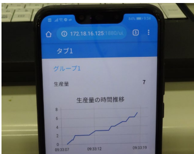
スマホ画面に表示されたデータ