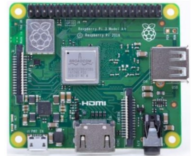
ラズベリーパイ 外観