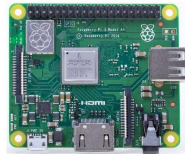
ラズベリーパイ 外観