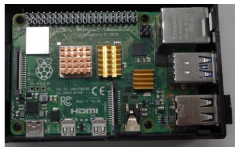
ラズベリーパイ 外観