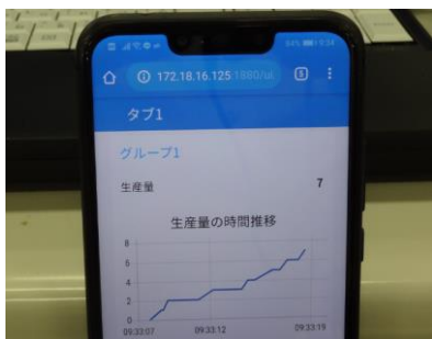
スマホ画面に表示されたデータ