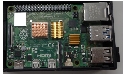
ラズベリーパイ 外観