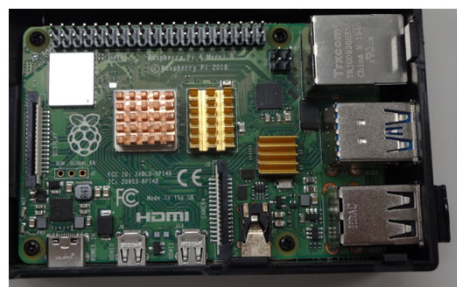
ラズベリーパイ 外観