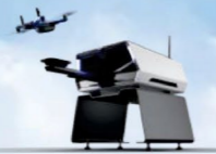
Skydio Dock for S2+(Indoor)