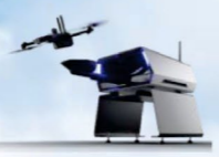
Skydio Dock for X2(Outdoor)