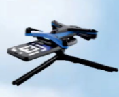
Skydio Dock Lite