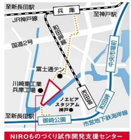
NIROものづくり試作開発支援センター